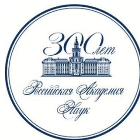
НС ОБН РАН по биологическим (биоресурсным) коллекциям