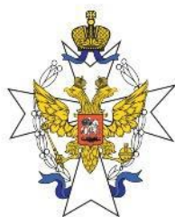
ФГБНУ «НИИ АГР им. Д.О. Отта»