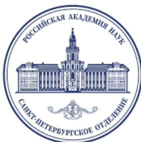
СПб отделение РАН